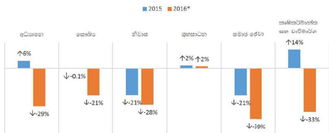
රූපය 1: අයවැයෙන් පොරොන්දු වූ මුදල් ප්‍රමාණය සහ සත්‍ය වශයෙන් වියදම් කළ මුදල් ප්‍රමාණය අතර පරතරය (ප්‍රතිශතයක් ලෙස)